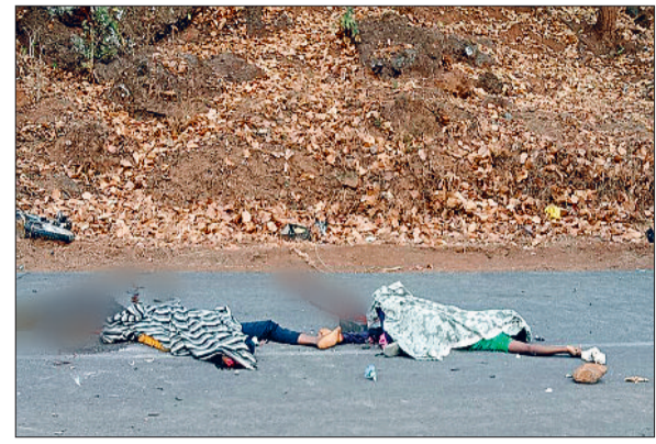
■ चिल्की नेशनल हाईवे में हादसा, आरोपी गिरफ्तार