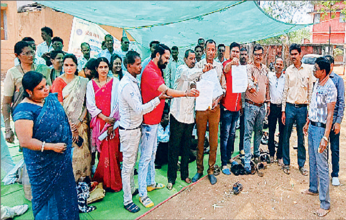
30 साल से कार्यरत

सत्ता मिलने के बाद सरकार उनकी अनदेखी कर रही है। उन्होंने बताया कि सचिव दिवस पर इंडोर स्टेडियम रायपुर में मुख्यमंत्री विष्णु देव साय, विधानसभा अध्यक्ष डॉ.रमनसिंह और अन्य मंत्रियों से शासकीकरण करने का निवेदन किया गया था जिसे स्वीकार कर कमेटी गठन किया गया। कमेटी का रिपोर्ट आने के बाद भी सरकार के ध्यान नहीं देने और बजट में शासकीकरण का प्रस्ताव नहीं होने के बाद आंदोलन किया जा रहा है।