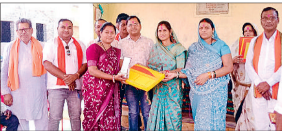
हरिभूमि न्यूज ►► खुजी

ग्राम गुंडरदेही में 22 मार्च को ग्राम पंचायत एवं जनपद पंचायत छुरिया के तत्वावधान में महिला दिवस एवं स्वच्छता सम्मान समारोह का आयोजन किया गया।