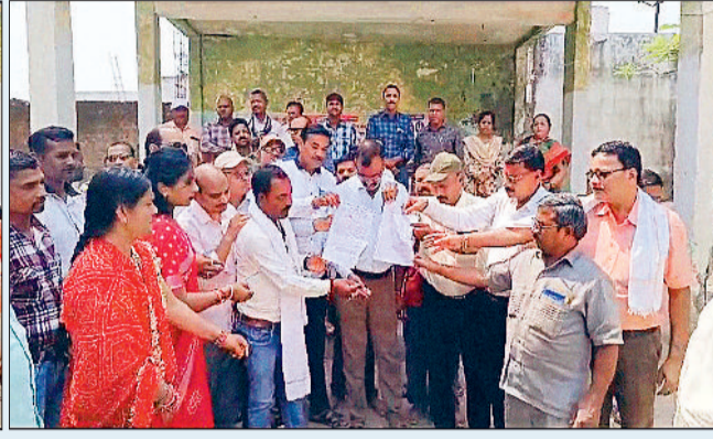
हड़ताल से पंचायतों का कामकाज प्रभावित

उत्तीसगढ़ सहित जिले में जारी आम पंचायत सचिवों की अनिश्चितकालीन हड़ताल पर कड़ा रुख अपनाते हुए पंचायत संचालनालय ने जिला पंचायत सीईओ को एक पत्र लिखा है। सभी जिला पंचायतों के मुख्य कार्यपालन अधिकारियों सीईओ को पत्र जारी कर हड़ताली सचिवों को 24 घंटे के भीतर काम पर लौटने का निर्देश दिया है। निर्देश का पालन न करने पर अनुशासनात्मक कार्रवाई की चेतावनी दी गई है।